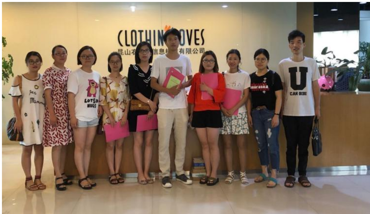
教师下企业教师照片（部分）