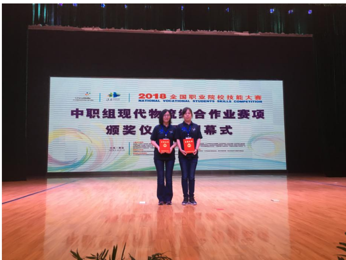
工作室成员获 全国职业院校师生技能大赛金牌教练称号