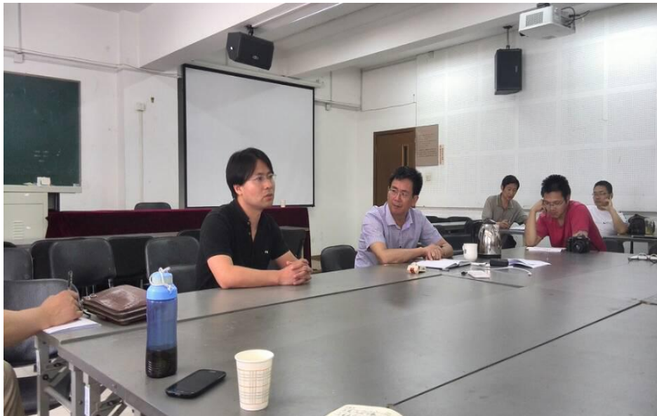
时间：2018年7月12日 活动：参加南艺单招艺术专业培训