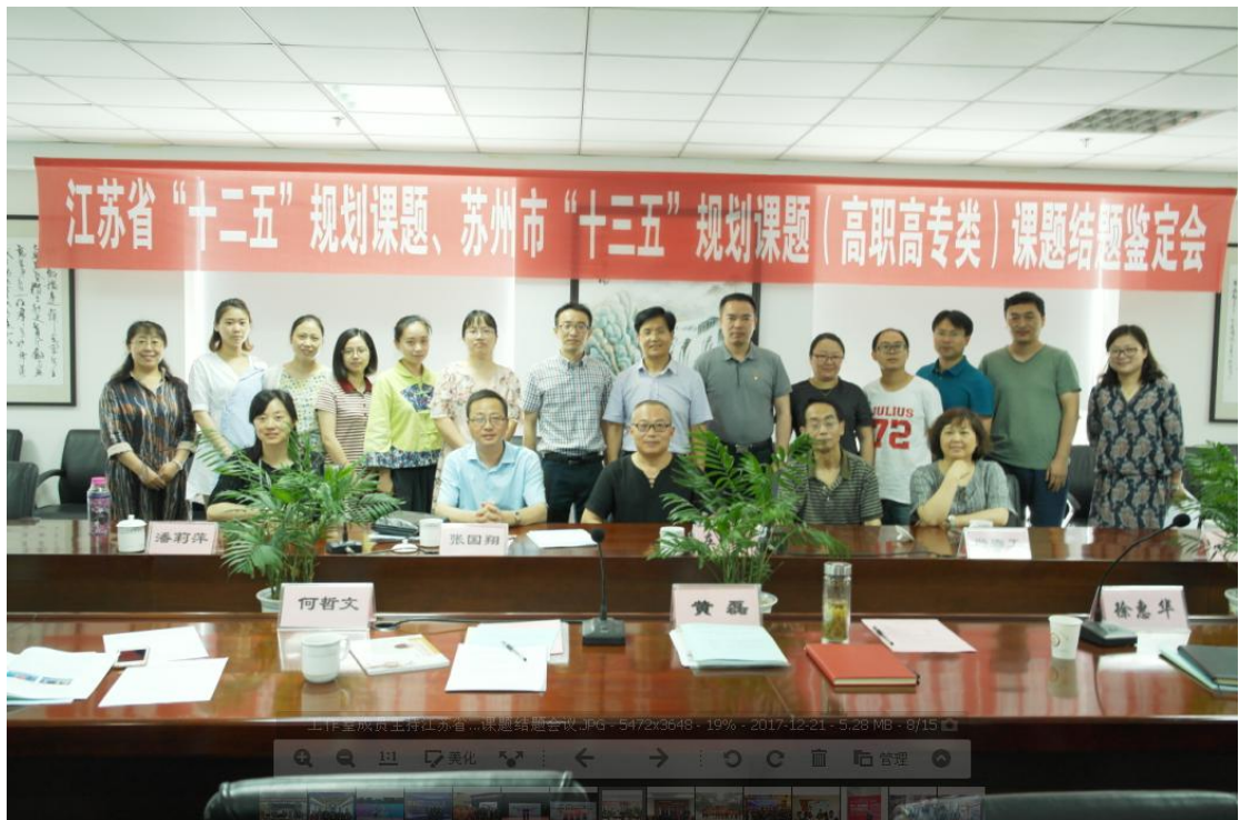
工作室成员主持江苏省十二五规划课题结题会议