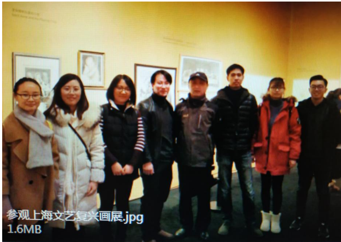
名师工作室成员参观学习上海文艺复兴画展