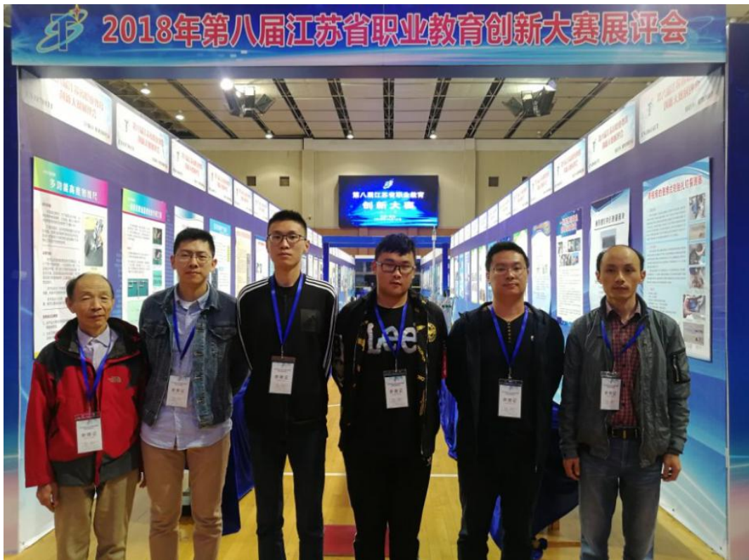
工作室成员参加江苏省第八届职业学校创新大赛