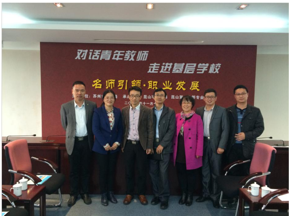
何哲文创新工作室参加青年教师共同成长主题活动