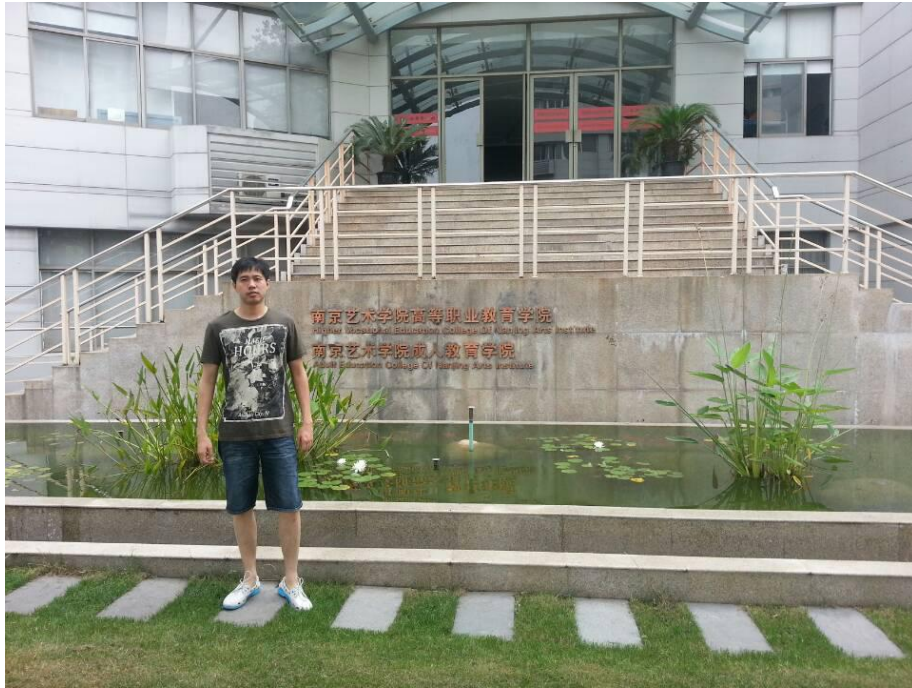
时间：2017年7月9日 活动：参加南艺单招艺术专业培训