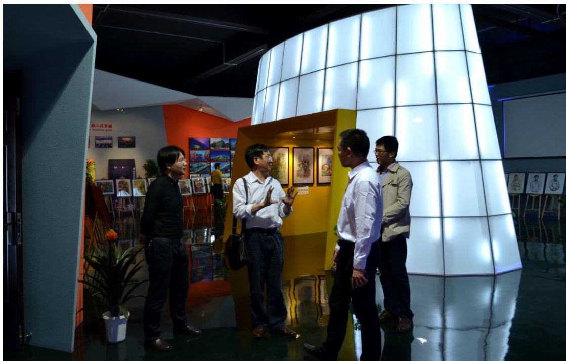
南艺高职院郑院长一行来我校校史陈列室指导