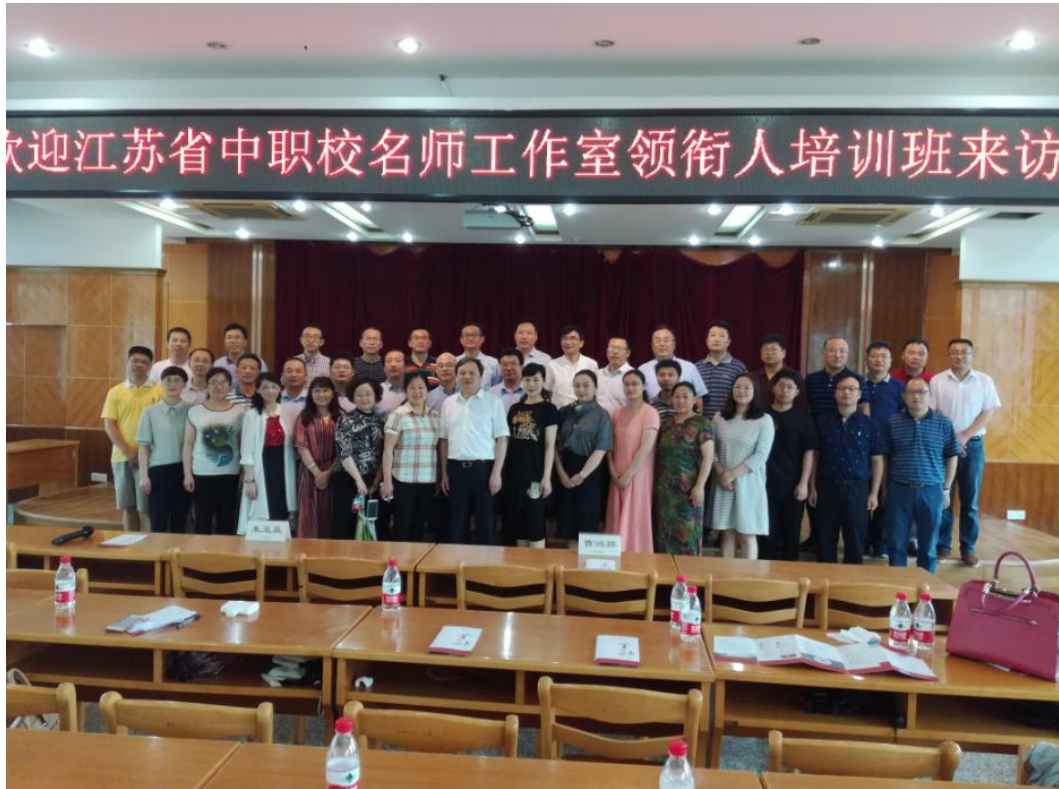
参加江苏省名师工作室培训班