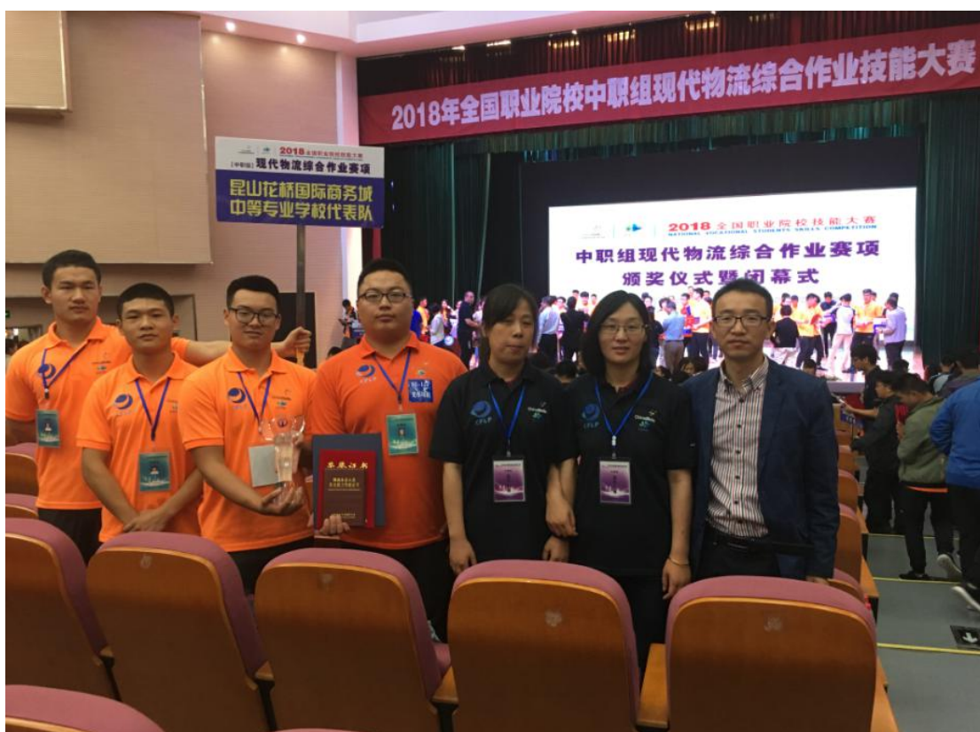
工作室成员获 全国职业院校师生技能大赛金牌